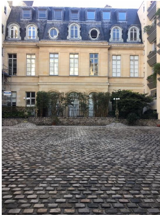
Cour donnant accès au parking