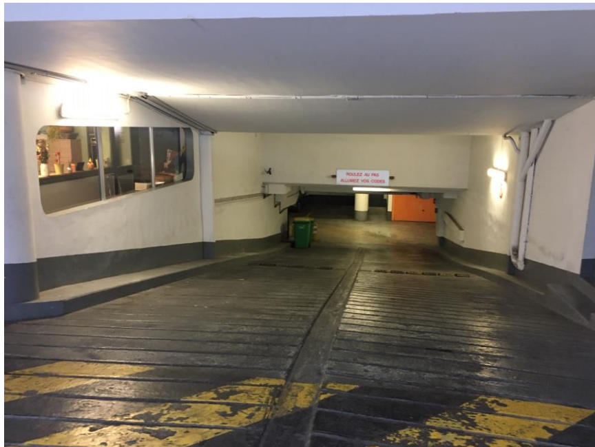
Loge gardien donnant sur la sortie