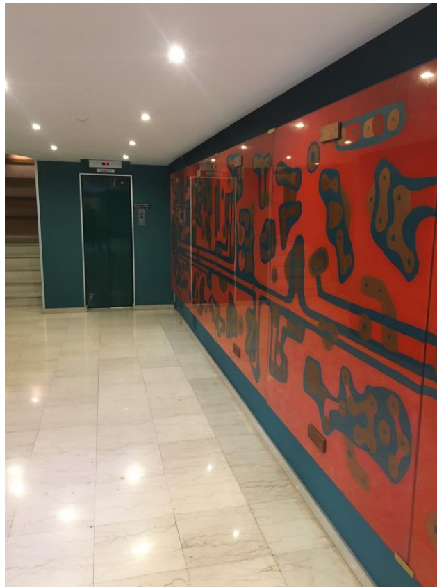
Hall d'entrée accès parking par ascenseur