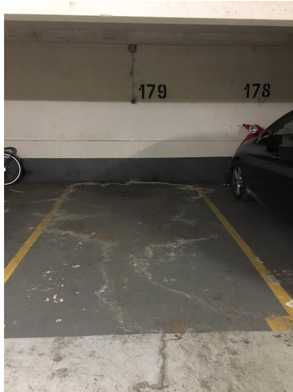
Place de parking