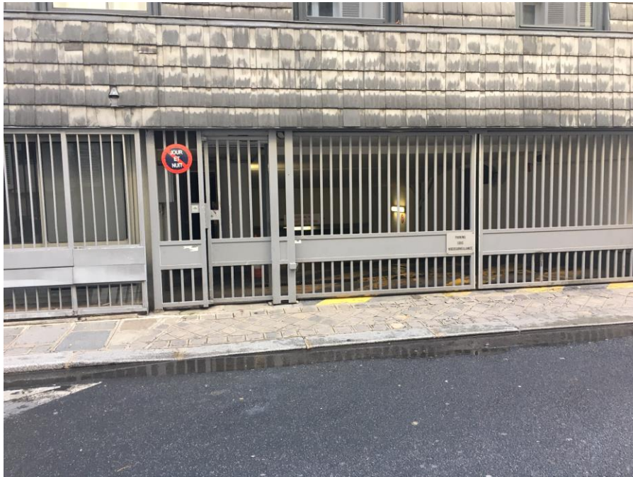
Sortie du parking rue de la Chaise