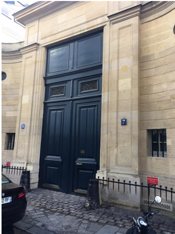
Porte d'entrée accès parking rue de la Chaise